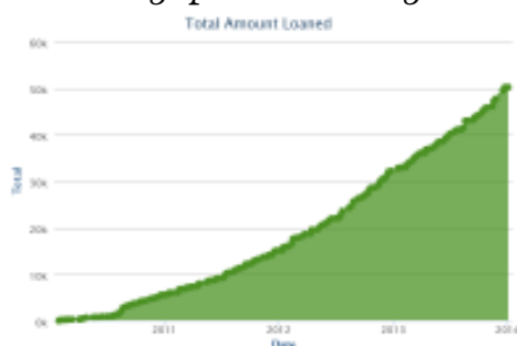
Aantal leningen over de jaren heen

In 2013 heeft de community $ 17000 aan ca. 700 leningen verstrekt. In de periode 2010-2013 zijn in totaal 1784 leningen verstrekt voor een totaal bedrag van € 50.000. In de eerste vier jaar van ons bestaan is het uitgeleende bedrag jaarlijks verdubbeld ten opzichte van het voorgaande jaar. In 2013 is het constant gebleven aan 2012, we willen in 2014 kijken of we terug kunnen gaan naar een verdubbeling. De totale portefeuille is erg divers en verdeeld over een groot aantal activiteiten. Leningen in de transportsector, taxiwereld en onderdelen voorziening spelen echter nog steeds een grote rol!